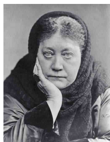
Helene Petrovna Blavatsky