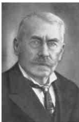
Theodor Fritsch ( ۱۸۵۵ - ۱۹۳۳ )

در ژانویه ۱۹۰۲ ، نشریه ای بنام " چکش " Hammer ، توسط یکی از دنباله روان لیست در آلمان بنام " تنودور فریچ " Theodor Fritsch آغاز بکار می کند که مسئولیت سازماندهی هواداران لیست در آلمان و گسترش اندیشه آریوسوفی در آنجا را برعهده دارد . از مجموعه جوامعی که تحت عنوان " جوامع چکش " در مناطق مختلف آلمان حول نشریه " چکش " شکل می گیرند ، در سال ۱۹۰۵ تشکیلاتی بنام " اتحادیه چکش رایش " Reichs - Hammer - Bund بوجود می آید .