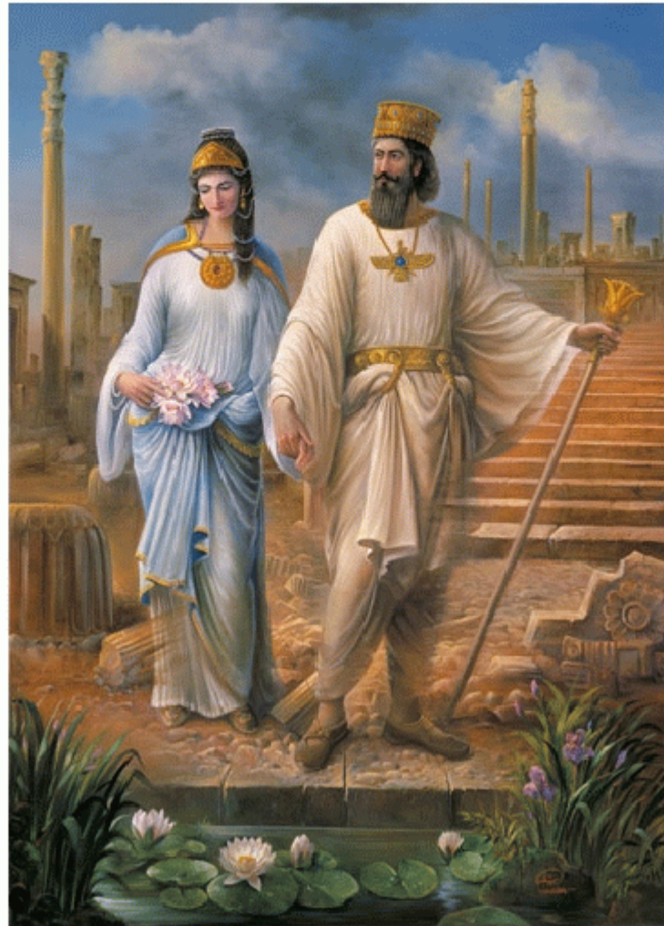
پاینده و جاوید ایران